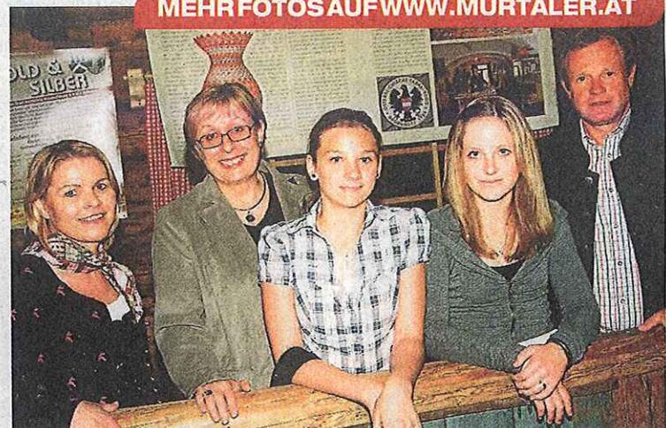
Schüler hatten sich perfekt auf die Präsentation vorbereitet.